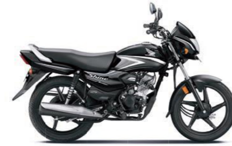
ग्रे के साथ ब्लैक

अभी ऑनलाइन बुक करें! www.honda2wheelerindia.com